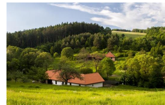
Obr. č. 1 Mikroregión Valašské Klobucko

Predmetom projektu je budovanie cykloturistickeho systému, ktorý spojí Zlínsky kraj (Východnú Moravu) s Trenčianskym krajom. Ide o výstavbu dvoch ucelených úsekov na českej strane a doplnenie siete cyklotransportu na slovenskej strane.