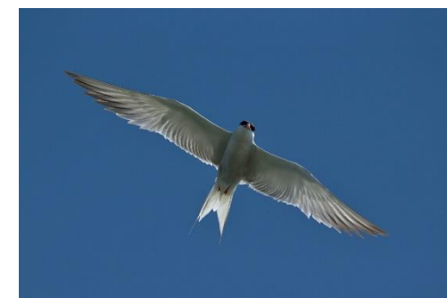
Obrázok 1 Rybár riečny - obnova hniezdnych biotopov

★ Všetky opatrenia budú realizované v Chránenom vtáčom území, ale aj v okolí dostatočne veľkom, aby sa minimalizovala šanca rýchleho návratu invázných živočíchov na lokalitu.