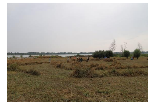
Obrázok 2 Šamorín – likvidácia porastov invázivných druhov rastlín