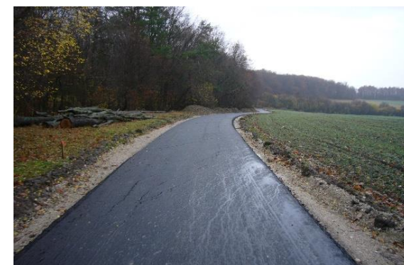
Obrázok 1 a 2 Cyklotrasa vo výstavbe