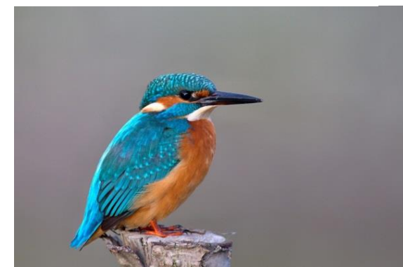
Obrázok 2 Rybárik riečny