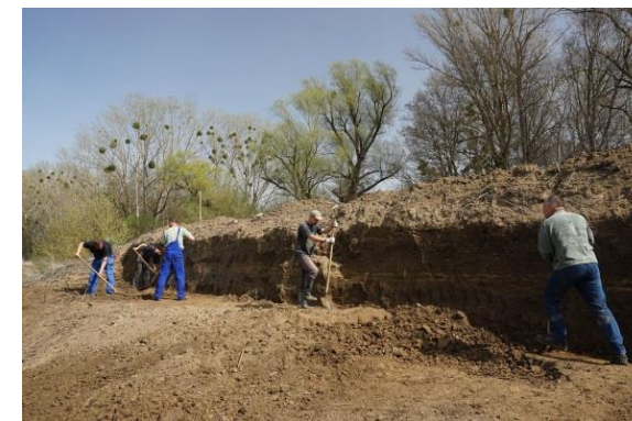
Obrázok 1 Obnova hniezdnych stien

★ Vodné toky spájajú krajinu a riečne ekosystémy privádzajú do krajiny život. Vplyvom meliorácií vodných tokov sa postupne vytráca prírodná rozmanitosť a všestranná funkcia vody v krajine. Zmyslom tohto projektu je vrátiť do riečnych biotopov rozmanitý život.