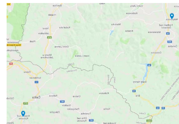
Obrázok 1 Partneri zapojení do realizácie projektu a ich poloha na mape

★ Mesto Krásno nad Kysucou a Obec Metylovice sú od seba vzdialené 60 km. Pohraničná poloha oboch partnerov prispieva k zvýšeniu intenzity cestovného ruchu tak pre domácich, ako aj zahraničných turistov.