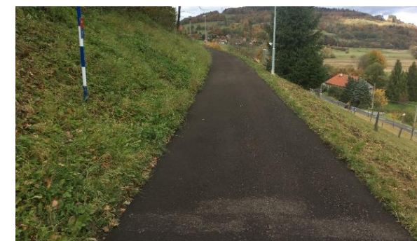
Obrázok 2 Jedno zo zákutí novej cyklotrasy