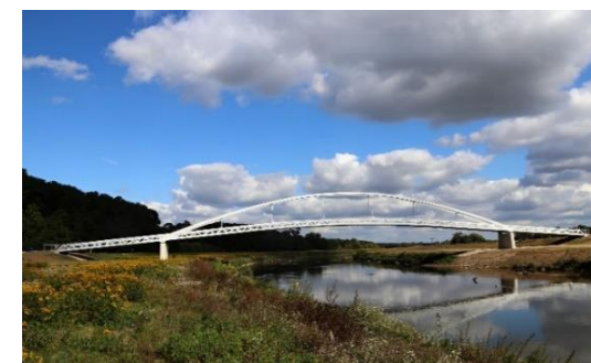
Obrázok 1 Lávka cez rieku Moravu

★ Realizácia projektu je vyústením snaženia Juhomoravského a Trnavského samosprávneho kraja o vytvorenie cezhraničného Archeoparku Mikulčice - Kopčany. Projekt prepája nielen pamiatky z čias Veľkomoravskej ríše, ale je zároveň spojením dvoch národných sietí cyklotrás v unikátnej prírode.