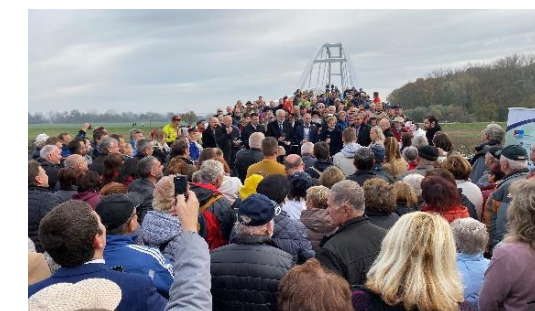
Obrázok 2 Slávnostné otvorenie lávky