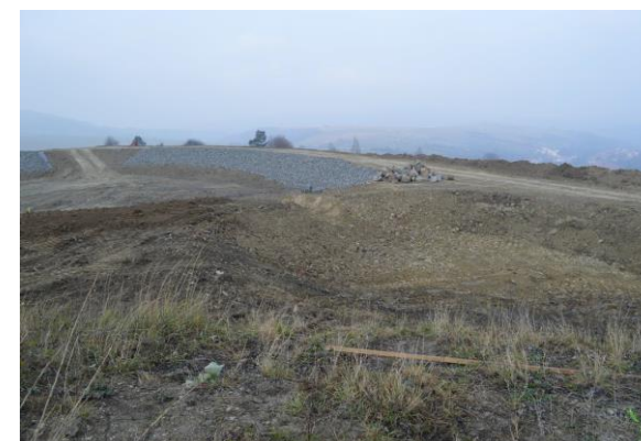
Obrázok 1 Obec Nová Lhota