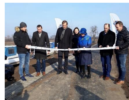
Obrázok 1 a 2 Otvorenie cyklotrasy pri Baťovom kanále