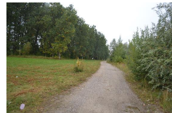
Obrázok 1: Pôvodný stav cyklotrasy

★ Vybudovaním a značením cyklotrás dôjde k prepojeniu prírodného a kultúrneho dedičstva cez hranice, ktoré sa nachádza v dotknutých regiónoch, napr. hrad Budatín, hrad Strečno, obec Hřčava, obec Čierne a mnohé ďalšie.