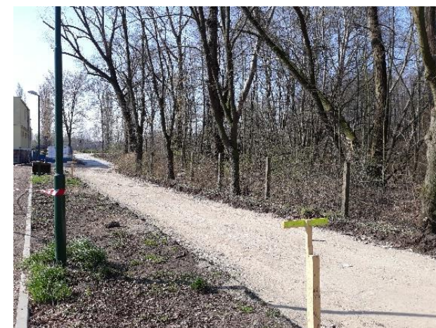
Obrázok 1 Fotodokumentácia z miesta realizácie

★ Realizáciou projektu sa vybudujú takmer 3 km moderných cyklotrás. Realizácia projektu prispeje k rozvoju cestovného ruchu a zároveň rozširuje potenciál pre sieťovanie cezhraničnej infraštruktúry.