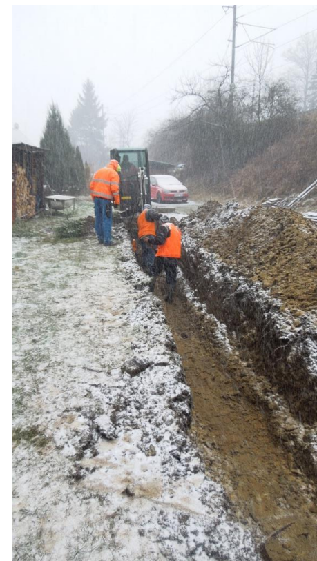
Obrázok 1 Fotodokumentácia z realizácie projektu