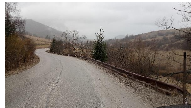
Obrázok 1 a 2 Fotodokumentácia z realizácie projektu