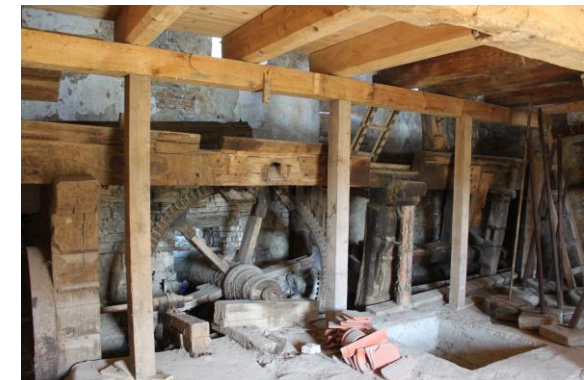
Obrázok 1 a 2 NKP Habánsky mlyn pred rekonštrukciou