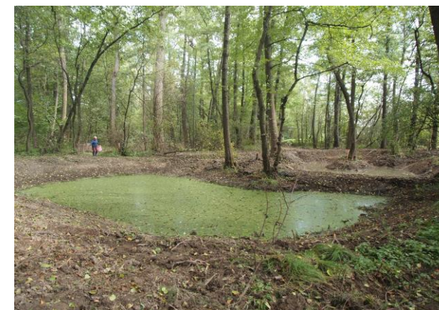
Obrázok 1 a 2 Práce na projekte začali v septembri 2019