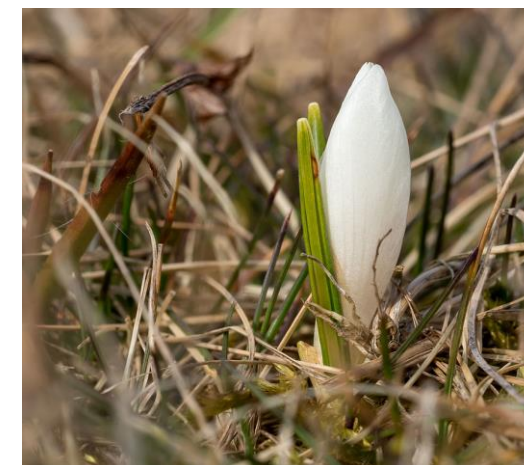
Obrázok 1 Šafrán Bielokvetý

★ Pre verejnosť bude na oboch stranách hranice zabezpečená mimo-publikačná a prednášková činnosť týkajúca sa problematiky projektu a web stránky.