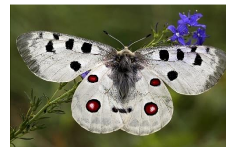
Obrázok 2 Jasoň Červenooký ( Parnassius Apollo )