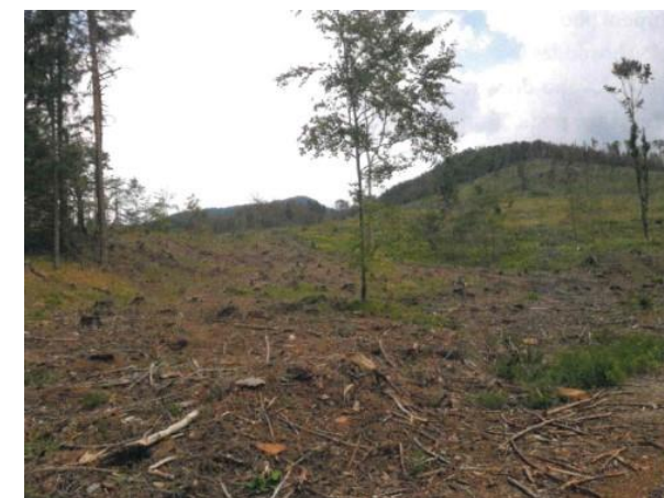
Obrázok 1 Fotografia poškodeného lesného ekosystému