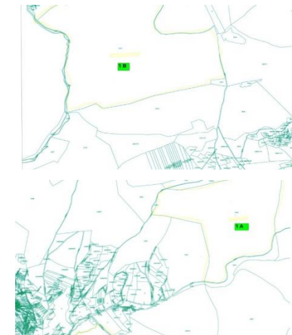
Obrázok 1 Katastrálna mapa