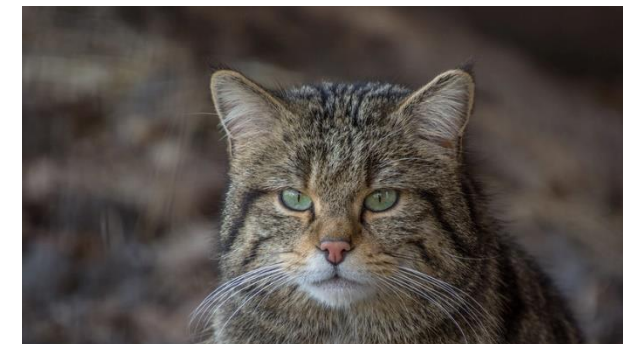
Obrázok 1 Mačka divoká ( Felis silvestris)

Dáta o početnosti a rozšírení mačky divokej, vytvorená metodika monitoringu a súbor odporúčaných opatrení budú môcť byť využité pre ďalšiu ochranu a manažment tohto druhu v oboch štátoch.