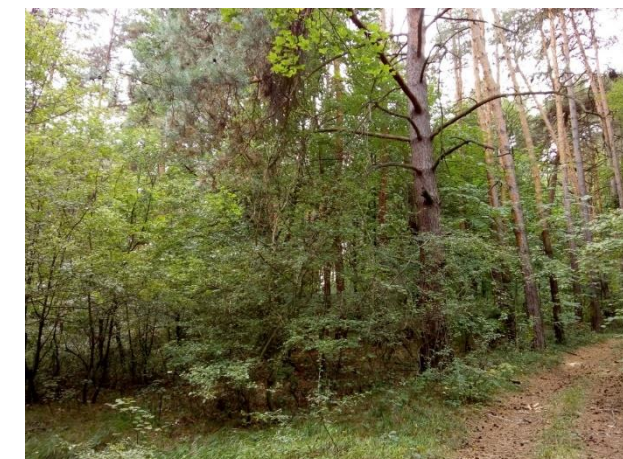
Obrázok 2 ZOO Bojnice – miesto vybudovania karanténnej a rehabilitačnej stanice pre Mačku divokú