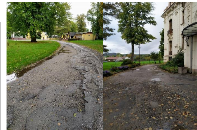
Obrázok 1 a 2 Miesto realizácie (HCP)