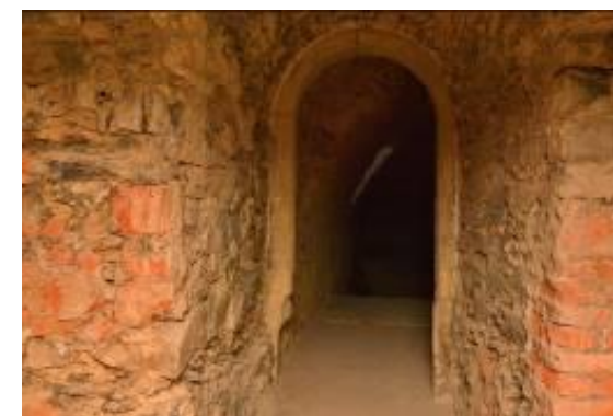
Obrázok 1 a 2 Zámok Bílovec pred realizáciou projektu