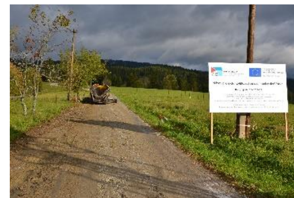
Obrázok 1 Umiestnenie informačnej tabule na mieste realizácie