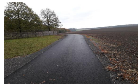
Obrázok 2 Aktuálny stav úseku cyklotrasy v obci Kuželov