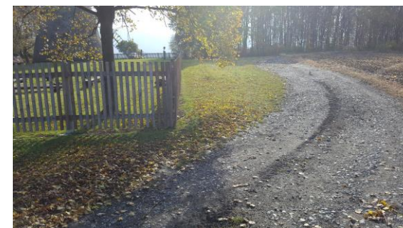
Obrázok 1 Úsek cyklotrasy v obci Kuželov pred realizáciou projektu

★ Cyklotrasa bude slúžiť návštevníkom z oboch strán hranice a spojí českú a slovenskú stranu v úseku medzi Kuželovom a obcou Vrbovce, k rovnakej sieti potom bude patriť aj rekonštruovaný chodník v obci Malá Vrbka.