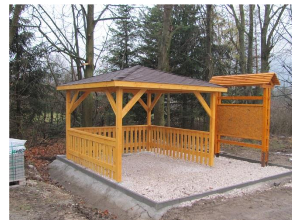
Obrázok 1 a 2 Oddychová zóna v obci Fačkov