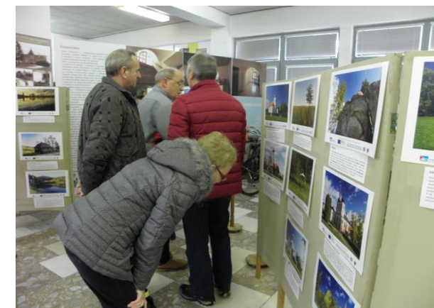
Obrázok 1 Výstava

★ Sústava vytvorených a vybavených trás a súvisiacich materiálov pre cyklistov i peších bude dôvodom pre zotrvanie v týchto pohraničných regiónoch. Zlepší sa športové využitie cezhraničného územia. Návštevníci regiónu zároveň nadobudnú praktické vedomosti o danom území.