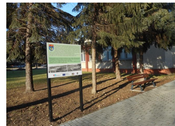
Obrázok 2 Informačná tabuľa + lavička