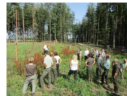
Obrázok 2 Úvodná terénna exkurzia