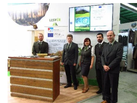
Obrázok 1 Medzinárodná výstava Natura Via

Skvalitnením životného prostredia a rozvojom turistickej infraštruktúry sa zlepšia životné podmienky obyvateľom a návštevníkom cezhraničného územia. Obnovou lesných a nelesných biotopov bude kladne podporený krajinný reliéf vo významných chránených oblastiach, ktoré svojou činnosťou formovala ľudská činnosť.