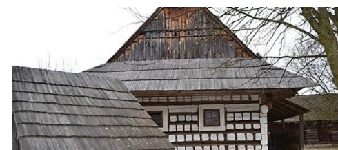
Obrázok 2 Kultúrne dedičstvo Javorníkov a Beskýd