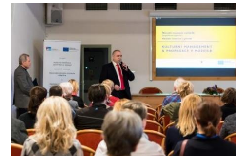
Obrázok 1 Konferencia Kultúrneho managementu a propagácie múzeí

★ Hlavným spoločným dopadom projektu je udržateľnosť kultúrneho dedičstva prostredníctvom ochrany a renovácie objektov ľudovej architektúry pre návštevníkov regiónov Javorníkov a Beskýd a zvýšenie atraktivity regiónov a kultúrneho dedičstva aj vďaka tvorbe prezentačného programu o remeselných a stavebných technológiách, ktoré sú základom pre zhodnocovanie kultúrneho dedičstva.