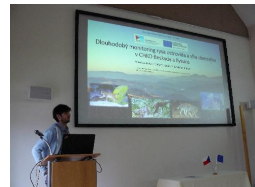
Obrázok 1 a 2 Spoločná prezentácia