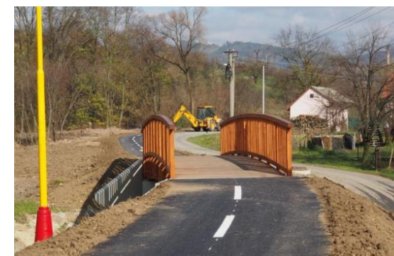
Obrázok 1 a 2 Cyklotrasa Bevlava