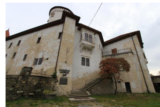
Obrázok 1 Hrad Budatín

★ Budatínsky hrad vznikol ako strážny hrad v druhej polovici 13. storočia. Postavený je na skalnom ostrohu na strategicky významnom mieste, pri brode na sútoku Váhu a Kysuce, kde sa vyberalo clo. Hrad Hukvaldy je jedným z najväčších hradov na Morave, a bol vybudovaný pravdepodobne v prvej polovici 13. storočia.