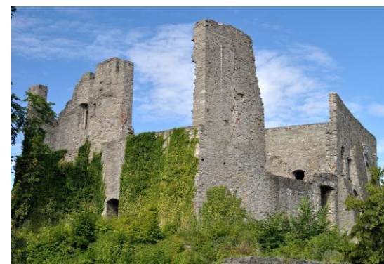
Obrázok 2 Hrad Hukvaldy