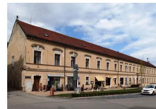
Obrázok 2 Zámok v Kloboukách u Brna