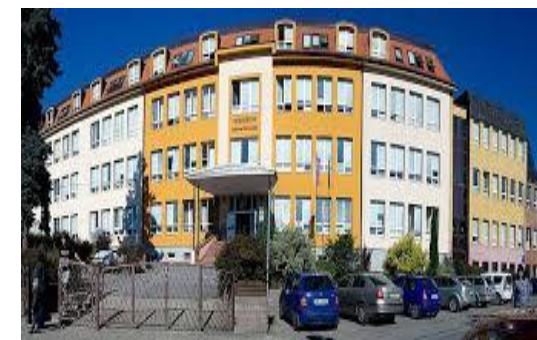
Obr. č. 1 Gymnázium Antona Bernoláka v Námestove

Projekt generuje potenciál pre jeho budúcu udržateľnosť. Akákoľvek investícia do oblasti vzdelávania, vzdelávacieho procesu s dôrazom na rozvoj kľúčových kompetencií, zručností a znalosti žiakov a pedagógov zvyšuje atraktivitu cezhraničných vzdelávaní u cezhraničných partnerov projektu. Ďalšou významnou úlohou predkladaného cezhraničného projektu je podporiť a motivovať žiakov netradičnými formami a inovatívnymi prístupmi k hlbšiemu vzťahu k informatike ako variabilnému a praktickému predmetu s výrazným uplatnením v ostatných predmetov a praktických veciach.