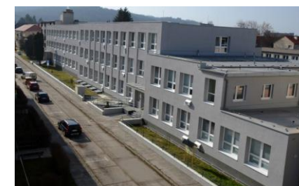
Obr. č. 2 Gymnázium Partizánske