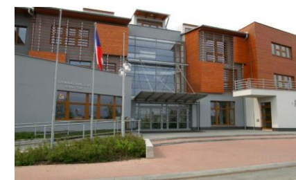
Obr. č. 1 Gymnázium Zlín- Lesní čtvrť

Obsahom projektu sú aktivity ako výmenné stáže pedagógov a študentov, nákup vybavenia potrebného k modernizovaniu výučby prírodovedných a technických predmetov a tvorba spoločnej internetovej prezentácie. Realizácia projektu podporí min. 320 študentov SŠ v ČR, 160 študentov SŠ v SR. Projekt bude mať dosah aj na pedagogických pracovníkov zapojených škôl.