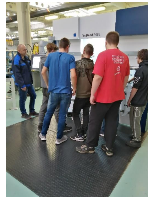
Obrázok 1 Ukážka modernej výučby na SOŠ