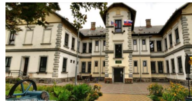
Obrázok 1 Muzeum naftového dobývání a geologie