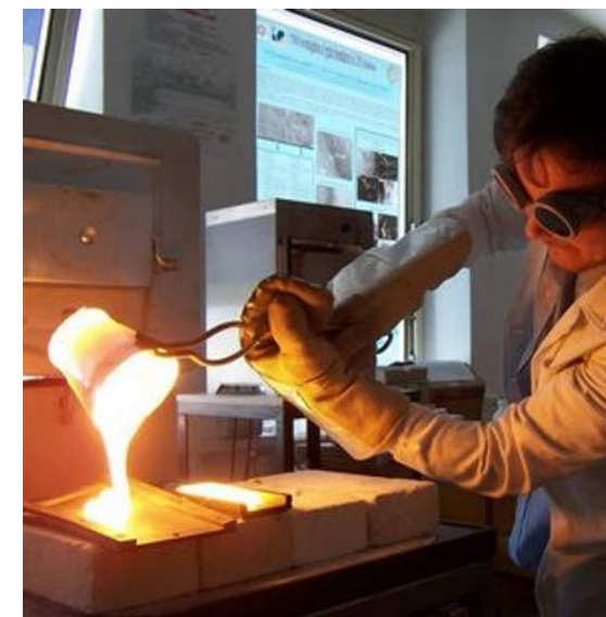
Obrázok 1 Centrum kompetencie pre výskum skla