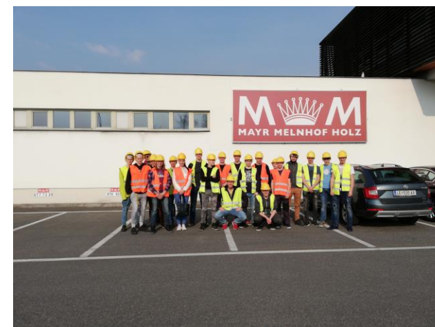
Obrázok 2 Exkurzia vo firme Mayr- Melnhof Holz Paskov s.r.o. – výmenný pobyt žiakov v ČR

Projekt prispieva k atraktivnosti a kvalite praktickej výuky v drevospracujúcich odboroch a tiež k rozvoji účinnej spolupráce medzi SŠ a zamestnávateľmi. Zdieľanie a výmena zahraničných skúseností a znalostí v rámci drevospracujúcich odborov je kľúčovým prvkom pre zvýšenie konkurencieschopnosti a uplatniteľnosti absolventov týchto odborov. Významnou potrebou realizácie projektu v rámci cezhraničnej spolupráce je spoločná popularizácie a vzájomná spolupráca pri skvalitňovaní praktickej výuky. Cezhraničný región a územie Beskyd medzi Ostravou a Žilinou má dlhú tradíciu v spracovaní dreva a bohaté zásoby tejto suroviny.