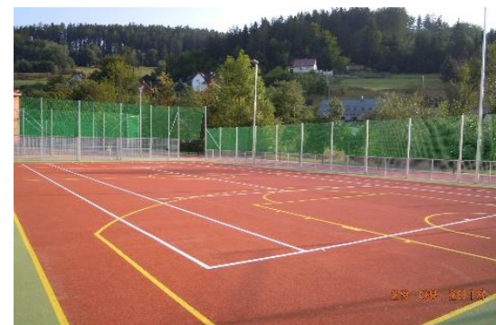
Obrázok 1 a 2 Realizácia projektu