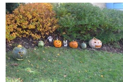
Obrázok 2 Záhradka základnej školy v Obci Breza