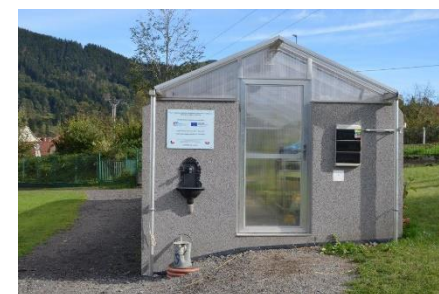
Obrázok 1 Skleník v Ostraviciach

★ V rámci pobytu sa slovenské deti v Obci Ostravice oboznámili so systémom výučby technických predmetov a najmä pestovateľských prác. Deti pracovali vo vybudovanom skleníku za účasti profesionálneho lektora osoby z praxe. V Obci Breza české deti pracovali v dielňach aj v pripravených triedach. Vyrábali výrobky z drôtu, z dreva aj z kombinovaných materiálov – drevo, plast. Podľa pripravených postupov vyrobili drevený stojan na perá v tvare psíka; z drôtu, dreva a plastu vyrobili Stromčeky šťastia. Venovali sa pečeniu vianočných koláčov. Pracovali v kuchynke pri príprave zdravých jedál s využitím dyne. V dielňach vyrábali svietniky a iné jesenné ozdoby.